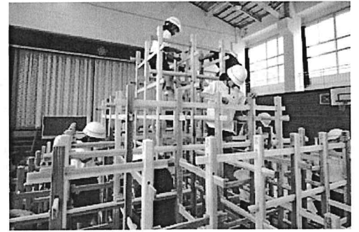
※写真は、ワークショップのイメージです

『くむんだー』とは、木のジャングルジムです。大型のジャングルジムの、約2週間ホールに設置して、みんなで遊べます。ひまわりさんには、その設置作業のお手伝いをしてもらう予定です。